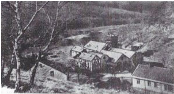
"Idyllisch schön lugt die Stätte der Arbeit zwischen den Hängern" (Koblenzer Volkszeitung 9.2.1935)

http://www.arenberg-info.de/hm/Grube.htm