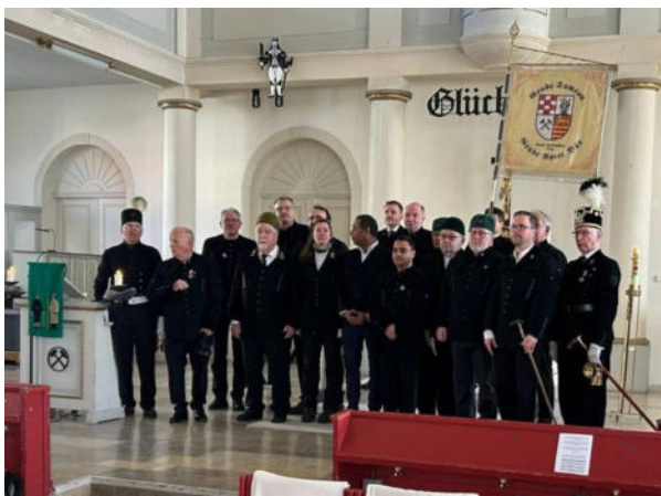
Bergdankgottesdienst 02. März 2025

https://www.youtube.com/watch?v=7P3w3B0NNsU