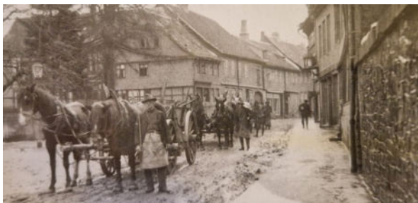
Foto Bäringerstraße, Goslar

https://www.google.de/books/edition/Zeitschrift_des_Harz_vereins_f%C3%BCr_Geschi/8jIRA-QAAIAAJ?hl=de&gbpv=1&dq=kinder+im+bergwerk&pg=PA41&printsec=frontcover