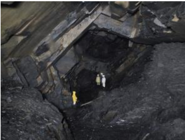
Befahrung der Schiefergrube am Nordberg, Goslar